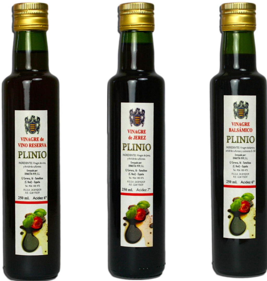
FORMATO BOTELLA VIDRIO 250 ML