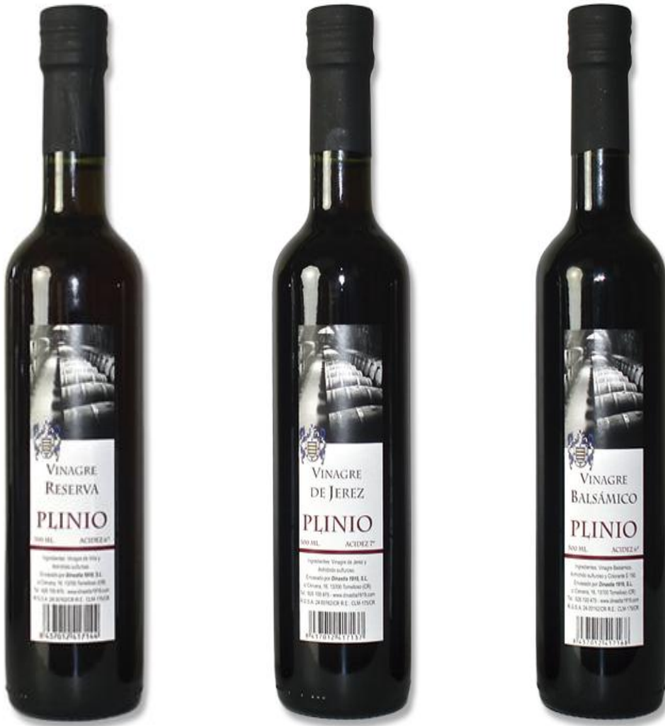
FORMATO BOTELLA VIDRIO 500 ML